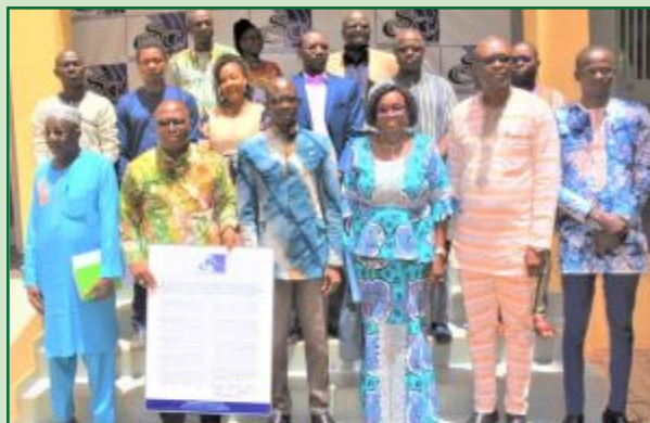
Un cadre du CSC, exposant sur les dix conseils

Pour lui, la diversité des acteurs de cette initiative permettra la promotion d'une utilisation saine, responsable et citoyenne des réseaux sociaux dans notre pays.