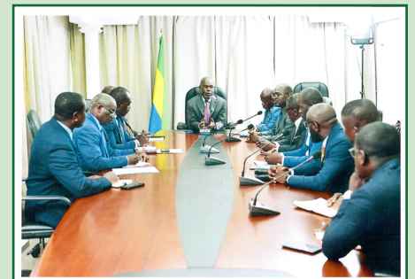
Vue partielle des participants à la rencontre.

Ils ont également saisi l'occasion de cette entrevue pour demander à la Haute Autorité de la Communication de se faire leur porte-voix auprès du gouvernement pour une meilleure prise en compte des préoccupations de la presse privée gabonaise, en butte à de nombreuses difficultés, parmi lesquelles celle relative à l'accès à la publicité institutionnelle.