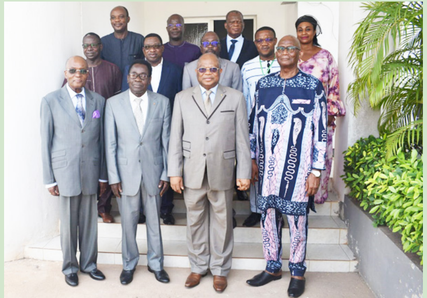
Photo de famille délégation CENI - membres de la HAAC

nous sommes obligés de nous retrouver et de faire ensemble une programmation pour le bon déroulement médiatique des élections. La CENI a l'expertise de la comptabilité mais la HAAC a l'expertise de la communication,