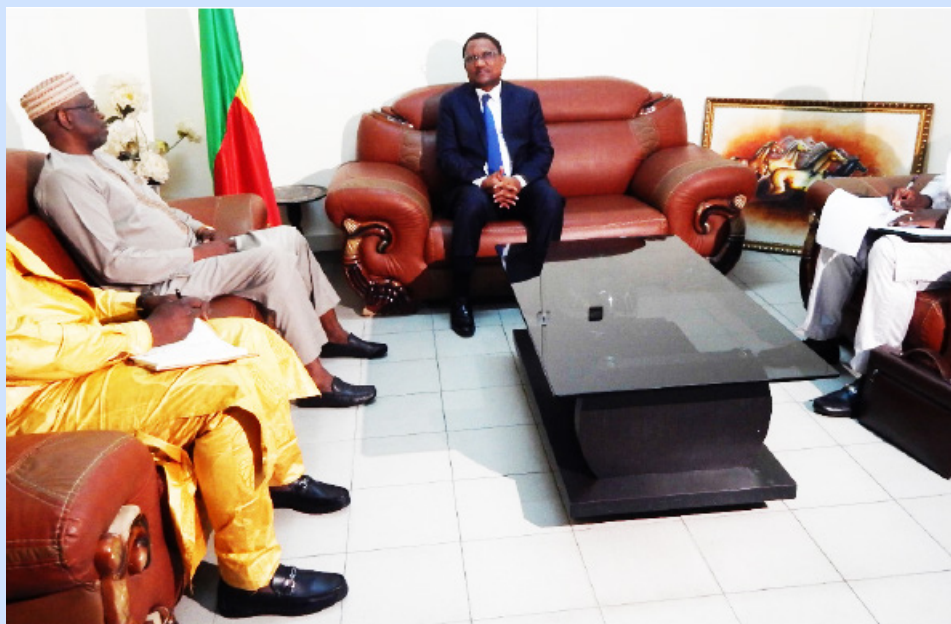
Un tête à tête entre la délégation de la HAC du Mali et le Président de la HAAC du Bénin.

Une délégation de la Haute Autorité de la Communication (HAC) du Mali a séjourné à Cotonou, du mardi 11 au mercredi 12 avril 2023. L'objectif de cette importante visite de travail et d'échange d'expériences est de s'enquérir de l'expérience du Bénin à l'effet d'améliorer leur pratique dans plusieurs domaines prioritaires de la régulation des médias.