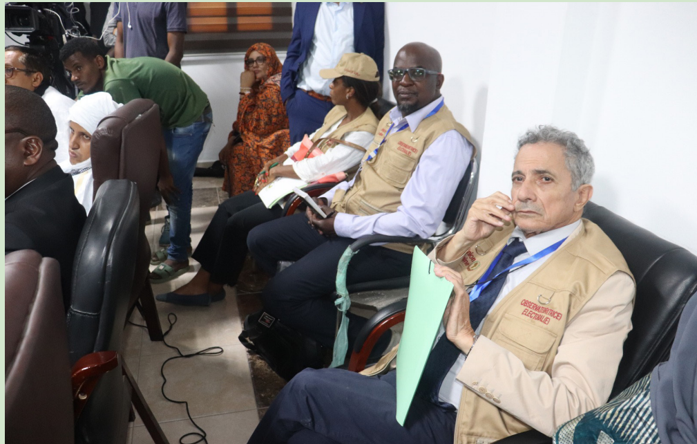
Vue partielle des participants

les partis politiques et les médias publics et privés, pour l'étroite collaboration tout au long du processus électoral.