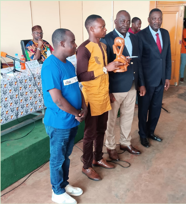
Vue remise du prix OLOFIO au représentant de la Radio BARANGBAKE

Les organisations professionnelles des médias, les journalistes et les étudiants du Département des sciences de l'information et de la communication (DSIC) ont célébré dans l'allégresse la journée mondiale de la liberté de la presse, à l'instar des hommes et femmes des médias du monde entier. Deux événements ont marqué cette journée : Conférence/débat suivi de la porte ouverte du département des sciences de l'information et de la communication qui a célébré ses 15 ans d'existence.