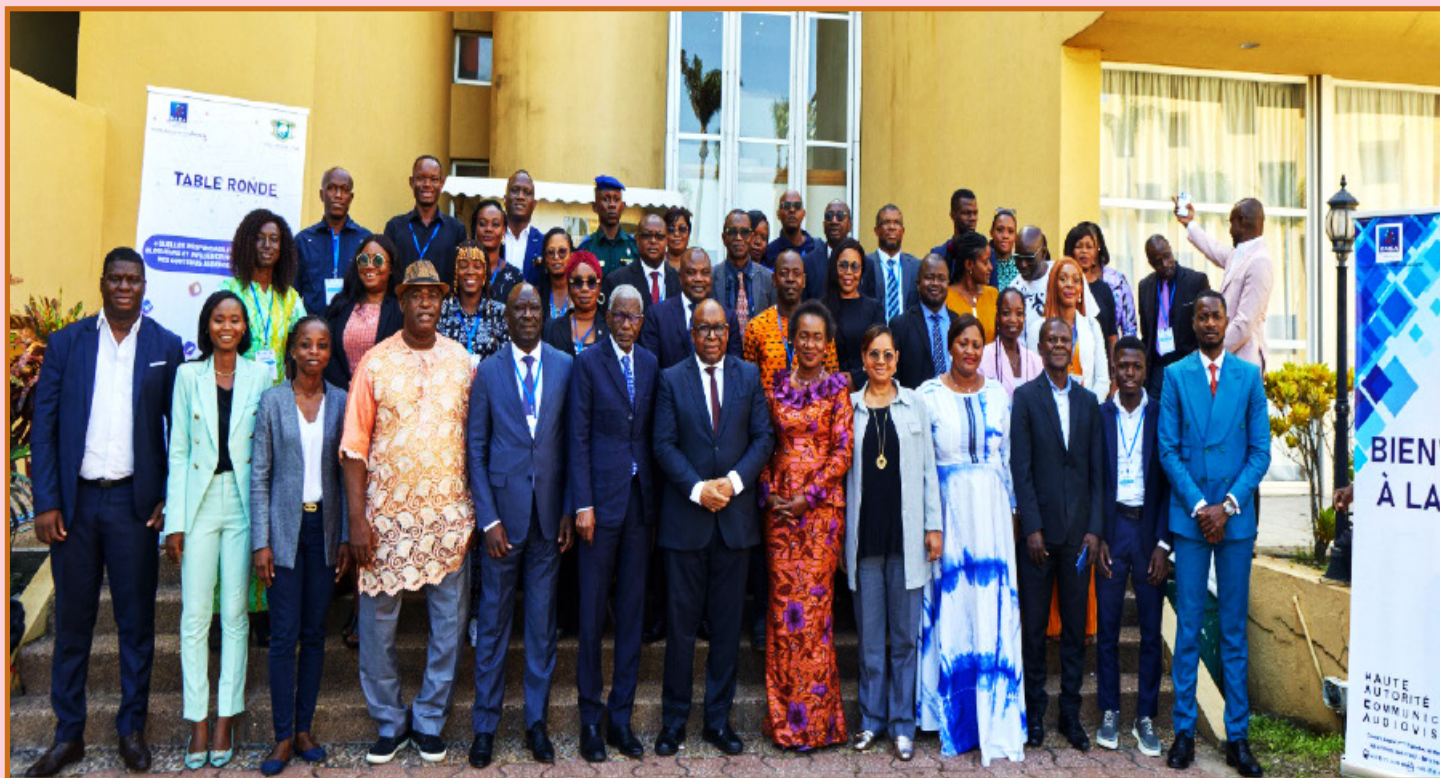
Photo de famille des participants à la Table Ronde

« QUELLES RESPONSABILITÉS DES ACTIVISTES, BLOGUEURS ET INFLUENCEURS DANS LA DIFFUSION DES CONTENUS AUDIOVISUELS EN LIGNE ? » ORGANISÉE PAR LA HACA DE CÔTE D'IVOIRE LE 17 MAI 2023 À HEDEN GOLF HÔTEL D'ABIDJAN.