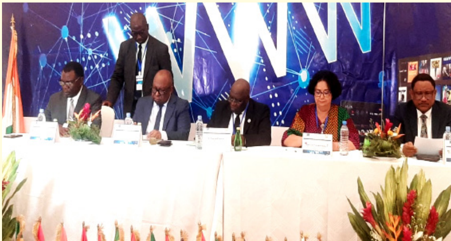
La tribune officielle à l'ouverture des travaux du colloque. De la gauche vers la droite, elle est composée des Présidents des instances de régulation du Cameroun, de la Côte d'Ivoire, du Maroc et du Bénin avec au milieu, le représentant du Président du CNRA Sénégal.