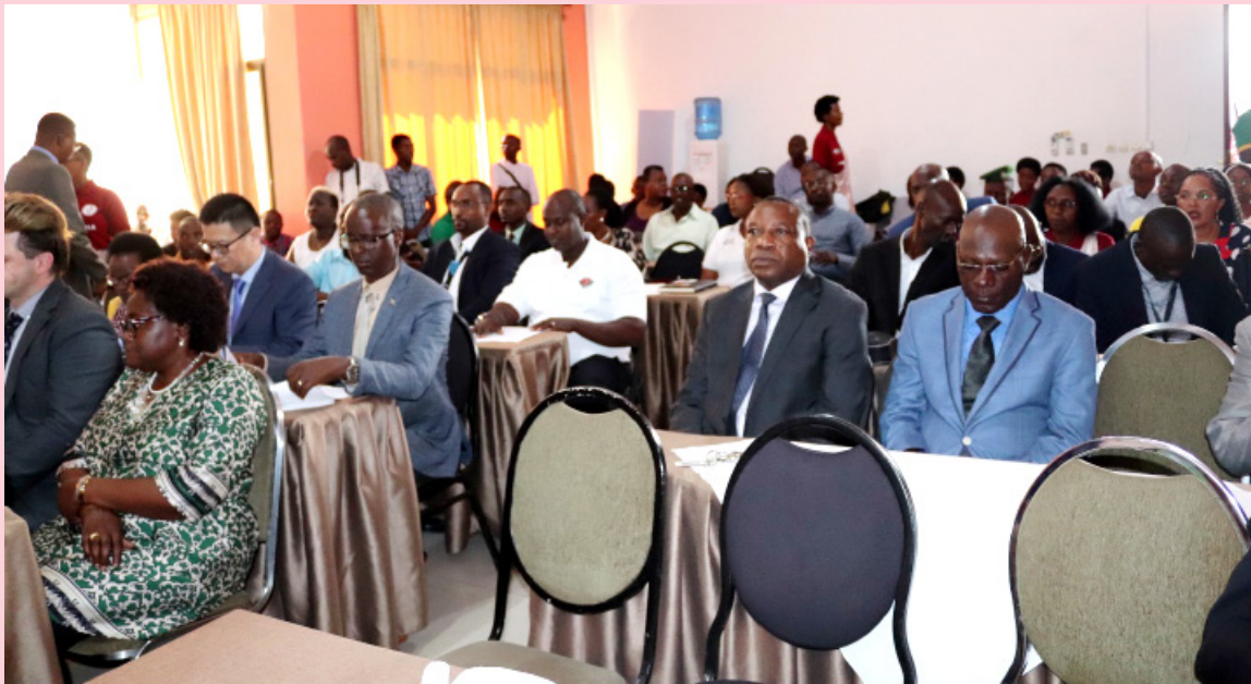
Vue partielle des participants aux cérémonies

Le CNC s'est rendu compte et se réjouit du fait qu'ils se sont adaptés au nouveau système de travail.