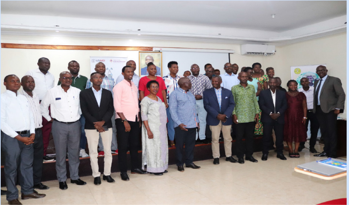
Photo de famille des participants à la session pour la première journée

organisent des synergies de médias. A ces inquiétudes soulevées, Ambassadeur Vestine Nahimana a dit que le constat majeur est que beaucoup de journalistes burundais accusent d'un manque d'esprit de discernement. Ils reçoivent des informations mais ne parviennent pas à y détecter le nécessaire.