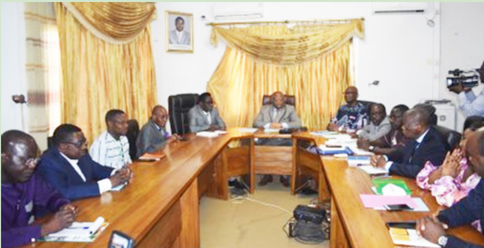
Les deux délégations, la CENI à droite et la HAAC à gauche

Le gouvernement togolais prépare activement les prochaines élections législatives et régionales. Dans cette perspective et conformément à l'article 10 alinéa 1 du Code électoral, qu'une délégation de la Commission Electorale Nationale Indépendante (CENI) a rencontré les membres de la Haute Autorité de l'Audiovisuel et de la Communication (HAAC). La rencontre avait pour but de réfléchir à cette collaboration dans la formation des agents des médias publics et privés ainsi que dans l'organisation de la campagne électorale. Les deux institutions se sont rencontrées au début du mois d'avril pour échanger sur une meilleure collaboration au siège de l'institution de régulation des médias à Lomé.