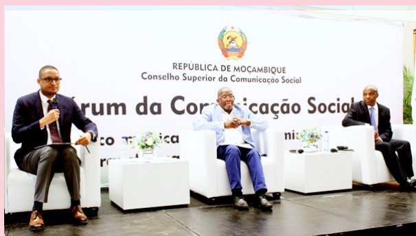
Quelques panelistes ayant animé le forum.