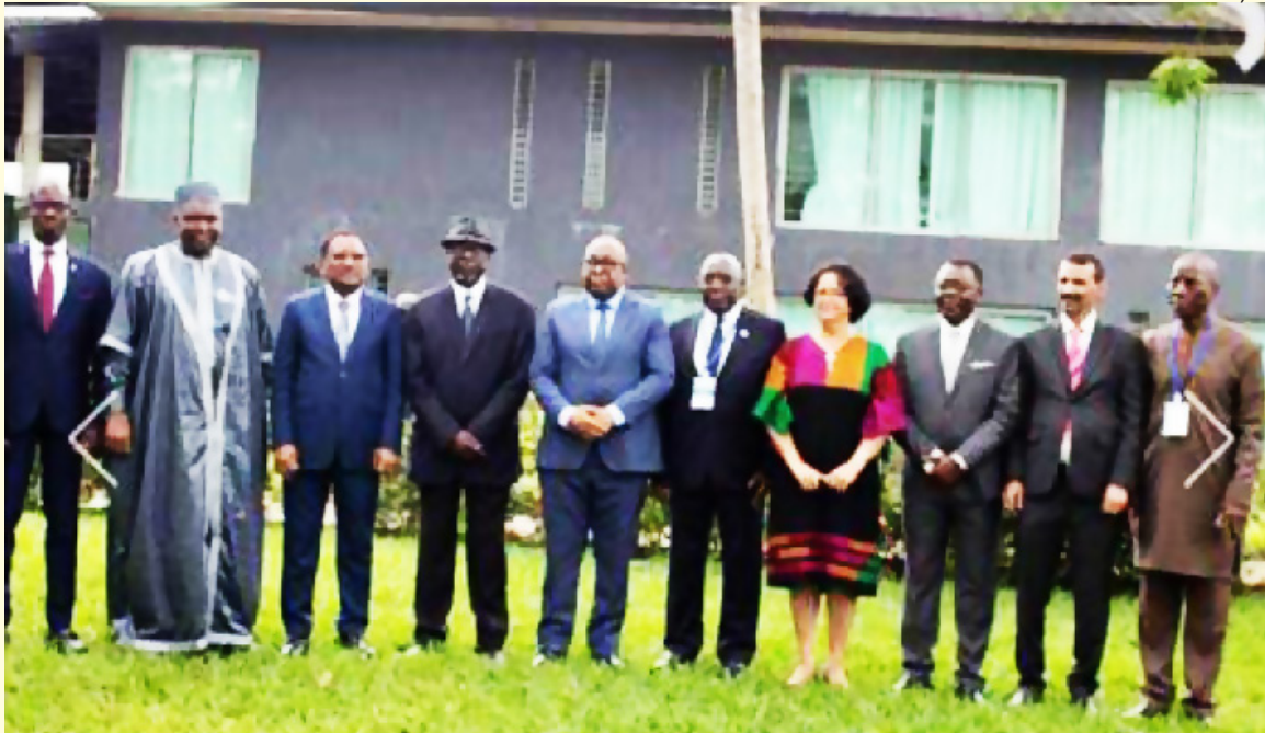
Photo de famille des Présidents ayant pris part au colloque

A son retour au pays le Président de la HAPA a adressé ses chaleureux remerciements au Président de la HACA, à la plateforme de L'UEMOA et de la Guinée et à tous les participants pour la qualité des travaux du colloque et l'accueil chaleureux qui lui a été réservé durant son séjour sur les bords de la lagune Ebriée.