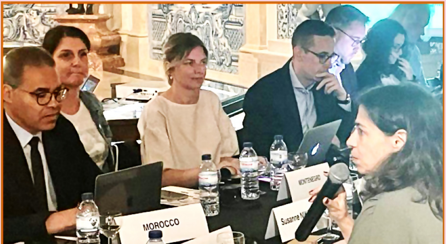
Vue partielle des participants à la réunion

A titre de rappel, la HACA avait été admise, en 2013,