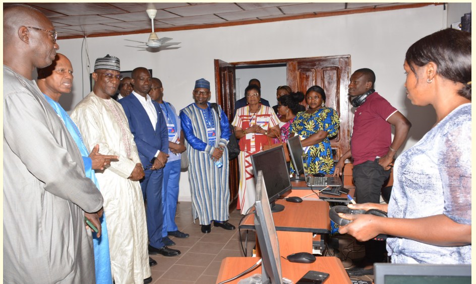
visite guidée des participants au centre de monitoring de la HAC Guinée

Au terme de ces échanges, les participants ont formulé les recommandations suivantes : Intégrer la régulation des contenus des réseaux sociaux, des Web radio et Web Tv dans les attributions des instances de régulation des médias, renforcer le pouvoir du Régulateur pour lui permettre de prendre des décisions urgentes dérogeant aux règles classiques en période de crise, inclure la régulation des médias publics dans les compétences du régulateur, promouvoir l'inclusivité linguistique à travers l'utilisation