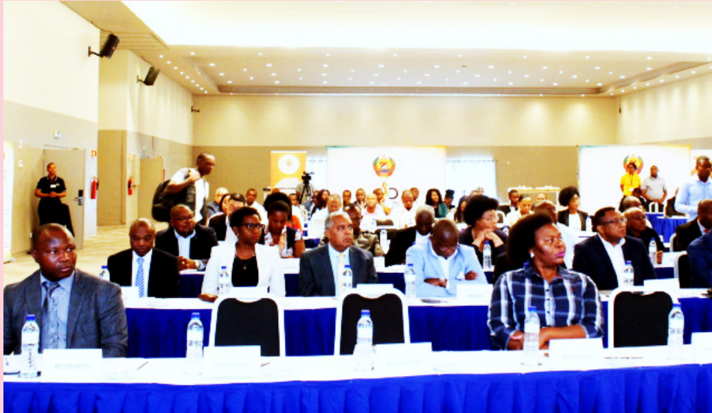
Vue partielle des participants

Le Forum de la communication sociale a permis une discussion ouverte sur les aspects de la communication sociale ; l'interaction et l'échange d'expériences entre journalistes de 3 générations, depuis l'approbation de la loi sur la presse en 1991 ; réflexion dans la classe journalistique sur son rôle et la question de l'éthique et de la déontologie à travers divers articles parus dans la presse ; l'analyse de la situation des médias au Mozambique et les défis dans l'exercice de la liberté