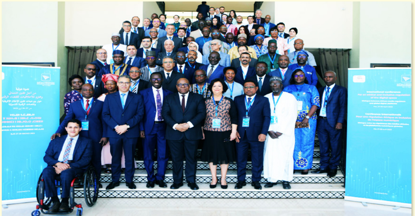
Photo de famille de tous les participants à la conférence.

A la suite des préoccupations exprimées par les Présidents d'Institutions de régulation et les participants, les représentantes des plateformes ont réaffirmé leur souhait de coopérer avec les régulateurs, décideurs politiques et experts technologiques. Elles ont déclaré avoir entendu le souci des régulateurs de voir une meilleure prise en compte de l'Afrique dans les politiques de modération. Les échanges qui ont suivi les présentations lors des panels ont révélé la nécessité de responsabiliser les Plateformes en ce qui concerne la question culturelle.