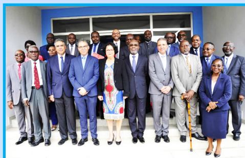
Photo de famille de la délégation marocaine et des membres de la HAC Gabon.

Ainsi, la collaboration actée par le paraphe ce jour de cette Convention-Cadre s'articule-t-elle autour de plusieurs axes, parmi lesquels : le partage par les deux instances de régulation de leur expertise