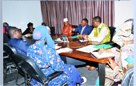
Vue partielle des participants lors de la séance de travail (en face à l'extrême gauche, le Président de la HAC Guinée).