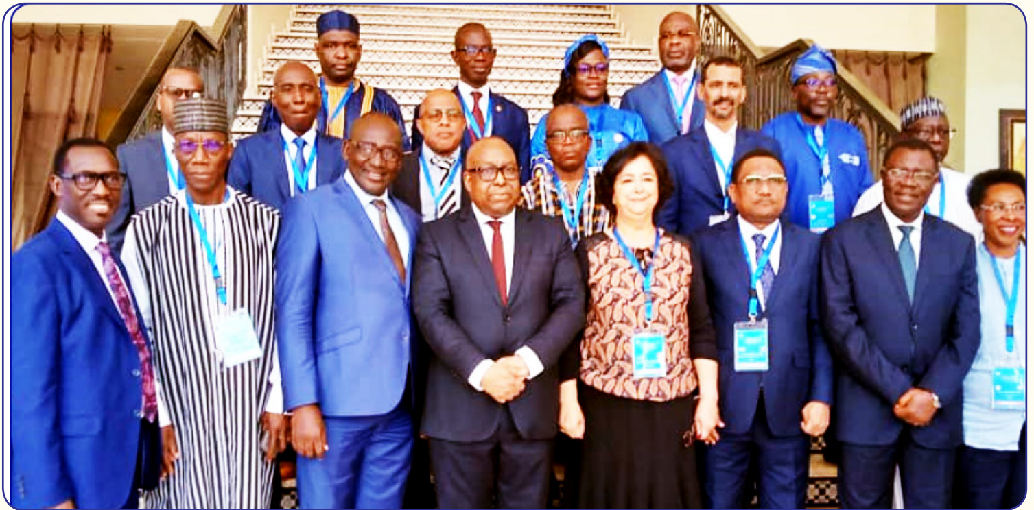
Photo de famille des Présidents et chefs de délégations des instances membres du RIARC ayant pris part à la conférence de Fès.