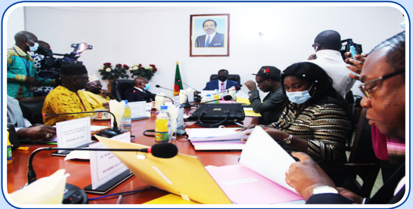
Séance plénière au CNC du Cameroun

« A l'occasion des élections des sénateurs qui se sont déroulées en mars 2023 au Cameroun, le Conseil National de la Communication (CNC) a une fois de plus déployé son système de monitoring sur toute l'étendue du territoire pour remplir sa mission de veille de campagne électorale ».