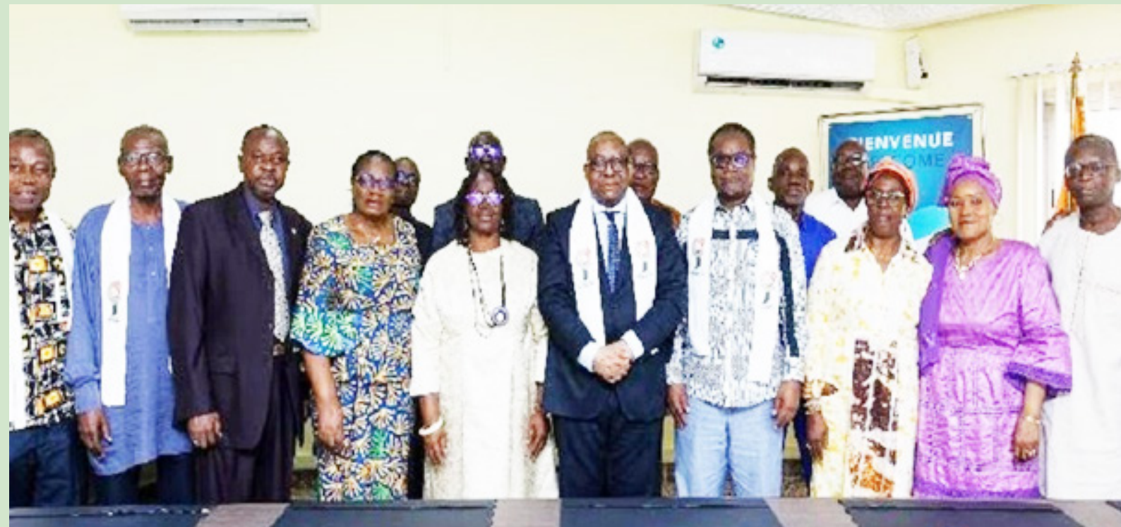
Photo des participants à la séance de travail