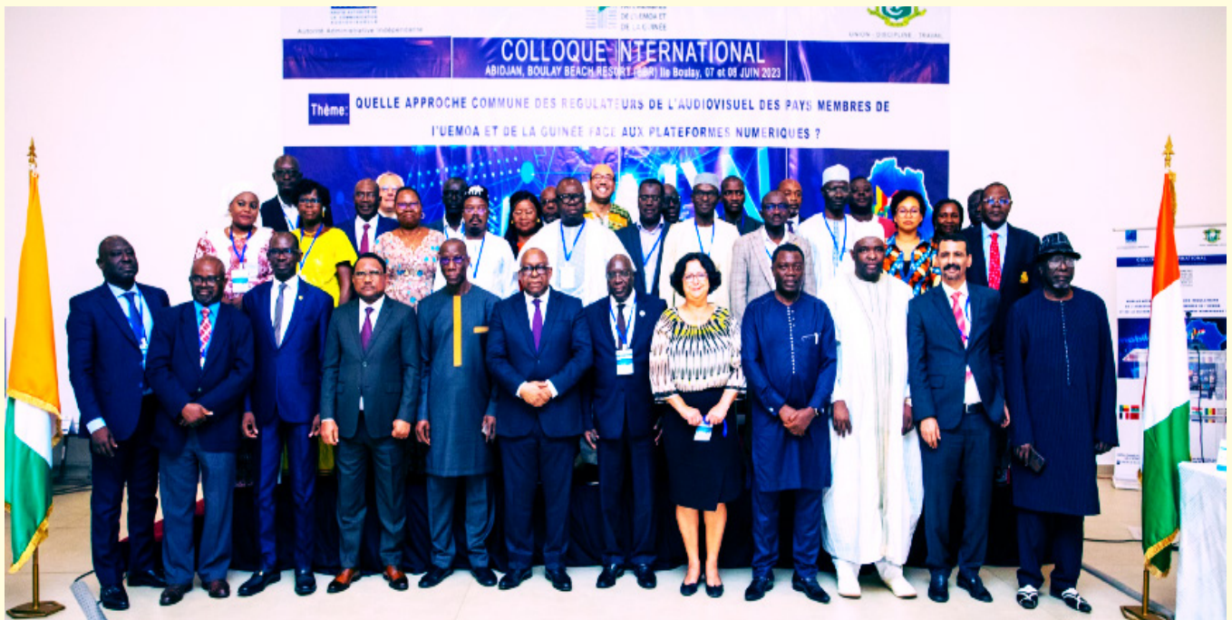
Photo de famille des participants

La Haute Autorité de la Communication Audiovisuelle (HACA) de Côte d'Ivoire a organisé les 07 et 08 juin 2023, à BOULAY BEACH RESORT (BBR) ILE BOULAY-ABIDJAN, dans le cadre des activités de la Plateforme des Régulateurs de l'Audiovisuel des pays membres de l'UEMOA et de la Guinée, un Colloque International sur le thème « Quelle approche commune des Régulateurs de l'Audiovisuel des pays membres de l'UEMOA et de la Guinée face aux Plateformes numériques ? ».