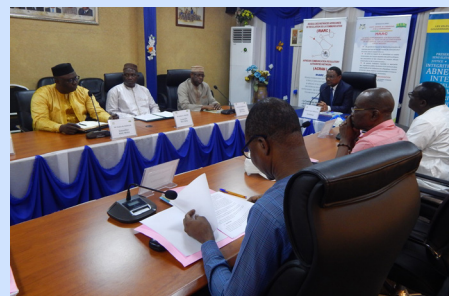
Séance de travail avec la délégation de la HAC du Mali et le Président de la HAAC et les Conseillers.