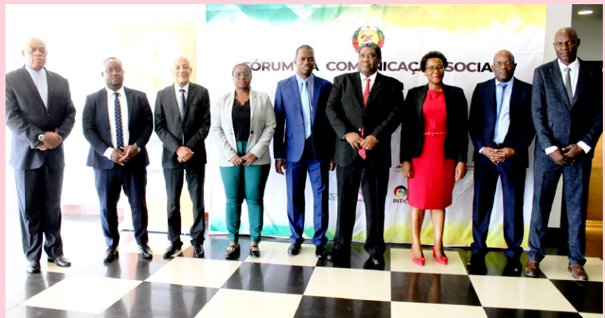
Photo de famille des membres du CSCS Mozambique.

devoir d'exercer ce noble métier avec une responsabilité éthique et déontologique. Deuxièmement, et sachant que la guerre est le moment qui génère les plus grands dichotomie et clivage dans le monde, le débat s'élargirait sur la manière de concilier les médias et l'agenda responsable des médias, avec la demande d'accès à l'information d'intérêt public, sur la lutte contre le terrorisme qui tourmente la population et détruit les infrastructures, notamment dans la région nord du pays. Il y aurait une opportunité de se concentrer sur la préparation des entreprises journalistiques, sans distinction, des rédacteurs et des journalistes en général, sur l'institution d'une Autorité de Régulation de la Communication Sociale, entre autres compétences, avec pouvoir de sanction, qui modèlera notre comportement et augmentera notre responsabilité dans l'exercice du métier de journaliste, avant tout. Enfin, une réflexion sera menée sur les implications matérielles et