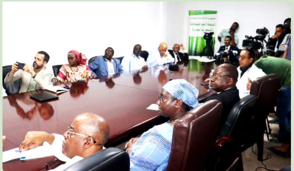
Vue partielle des participants

utilisé leur part d'annonces dans les deux journaux.